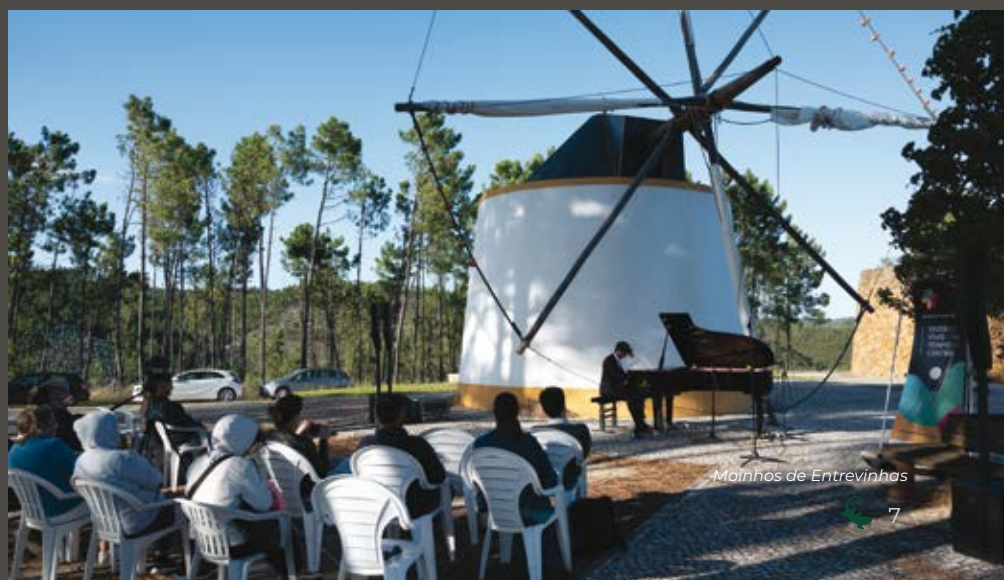
Moinhos de Entrevinhas