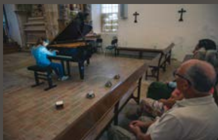
Igreja de Santa Maria da Caridade

O Roteiro IX do “Viver ao Vivo, com Tempo no Centro” decorreu nos dias 25 e 26 de junho e trouxe ao Sardoal um conjunto de iniciativas de elevado interesse. O workshop de Arte Comunitária “Pano para Mangas” teve lugar nos dois dias da iniciativa e juntou dezenas de participantes em volta da criação artística. Tecidos, tesouras, agulhas e linhas foram os materiais utilizados para desenvolver originais criações feitas a partir de mangas de camisas.