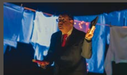
Centro Cultural Gil Vicente

Este foi o último roteiro do “Viver ao Vivo, com Tempo no Centro”, um projeto de Programação Cultural em Rede entre os Municípios de Sardoal, Castanheira de Pera e Celorico da Beira, coordenada pela Academia Internacional de Música “Aquiles Delle Vigne” e subsidiada a 100% por fundos comunitários.